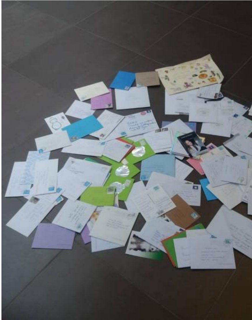
Opbrengst van 1 dag in Ter Valcke